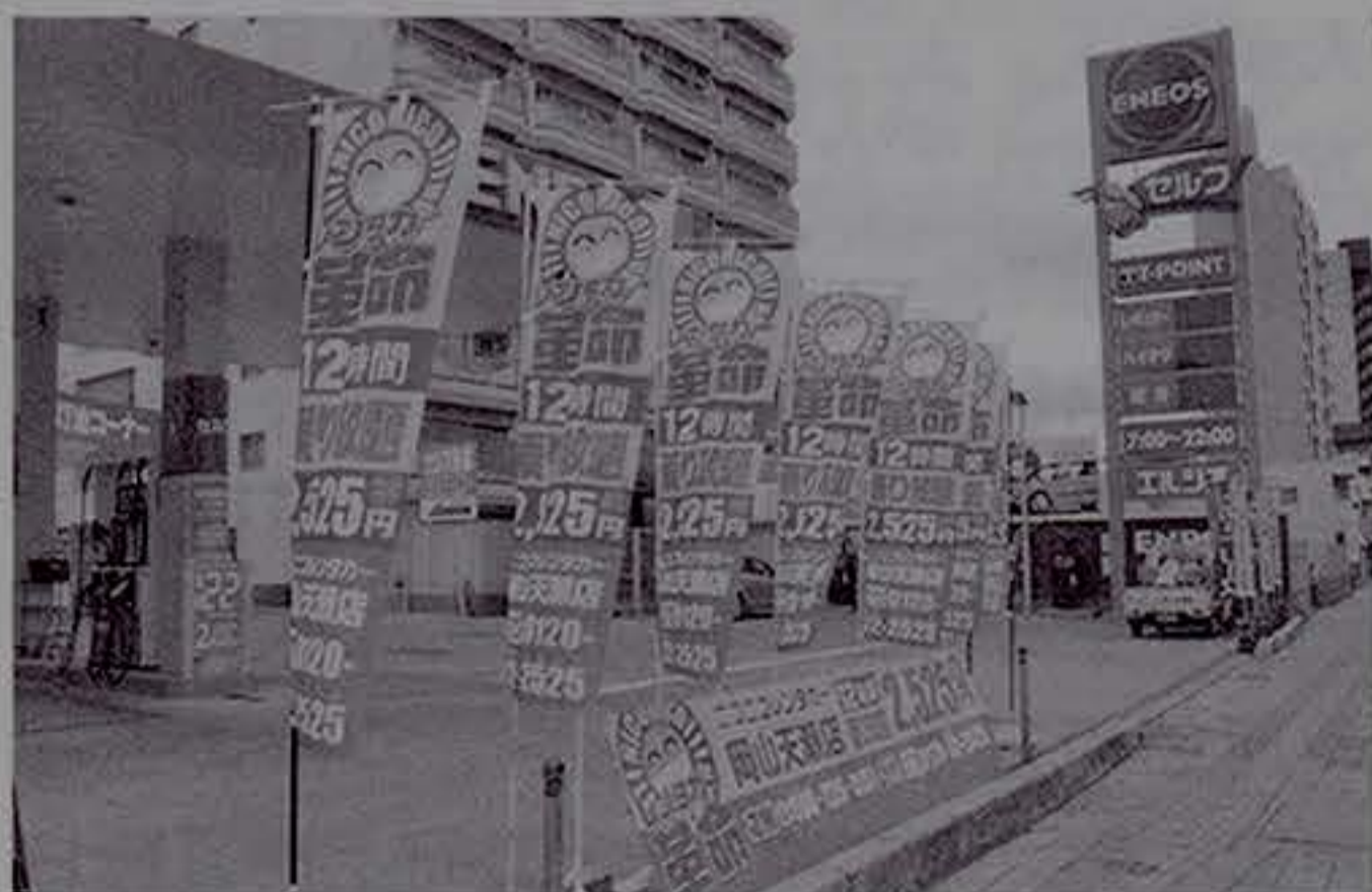
既存GS内にオープン

電話番号は086-225-0351。申し込みは、24時間対応のニコニコレンタカー受付センターのホームページ（ http://2525r.com/ ）へ。